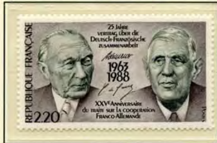
Konrad Adenauer 1876 - 1967