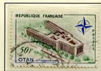
Le Palais de l'OTAN Porte Dauphine