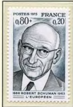
Robert SCHUMAN 1886 - 1963