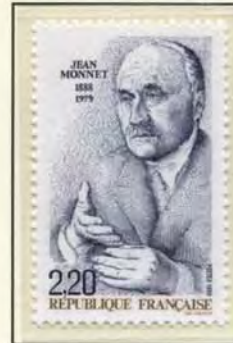
Jean MONNET 1888 - 1979